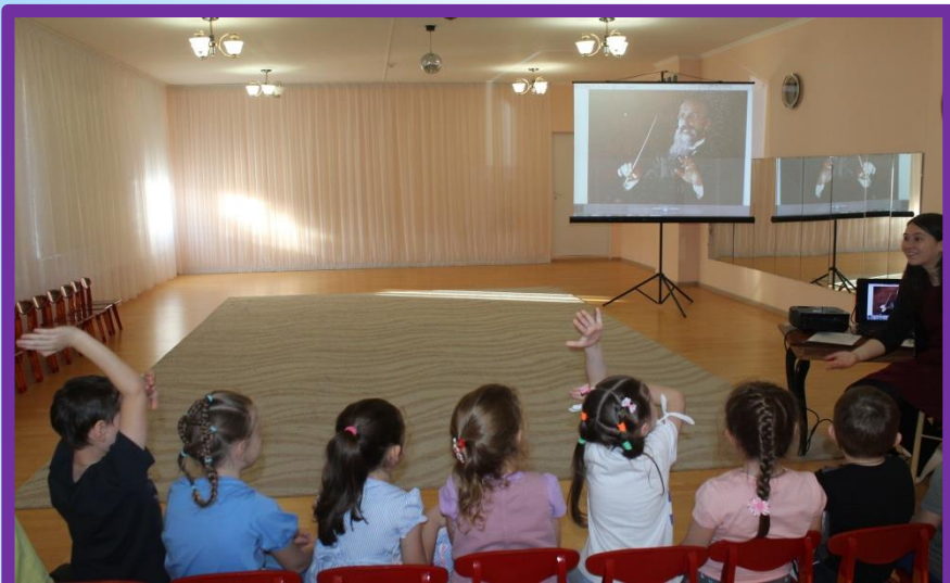
Беседа о композиторе Н.А. Римском-Корсакове

Слушание произведения «Океан- море синее» вступление к опере «Садко» Н.А. Римского-Корсакова, с просмотром видео о морских просторах и морских обитателях